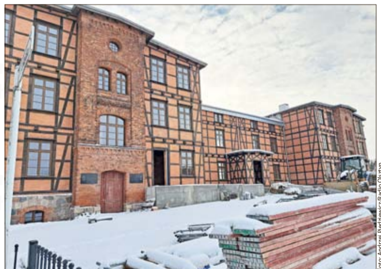
Ehemalige Kaserne in Soldau, später deutsches und sowjetisches Lager, bald Gedenkort

Gegründet wurde Soldau als Arbeitserziehungslager, wurde dann Kriegsgefangenen- und zuletzt Durchgangslager, doch unabhängig vom Namen diente es der Liquidation von Polen und Behinderten. Hierbei ging es zum einen um die sogenannte Intelligenzaktion, also den Mord an der polnischen Elite. In Soldau wurden zum Beispiel im Vergleich zu anderen Lagern überdurch-