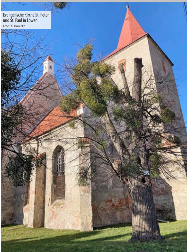
Evangelische Kirche St. Peter und St. Paul in Löwen