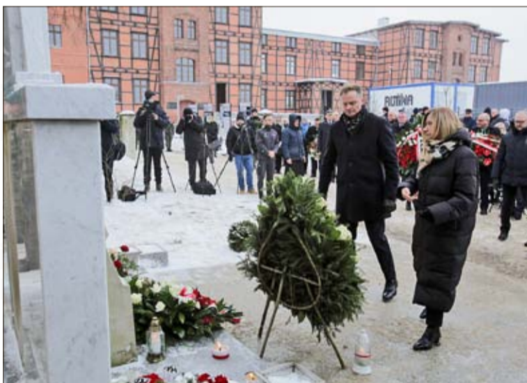
Erinnerung an die Opfer zweier Totalitarismen in Soldau