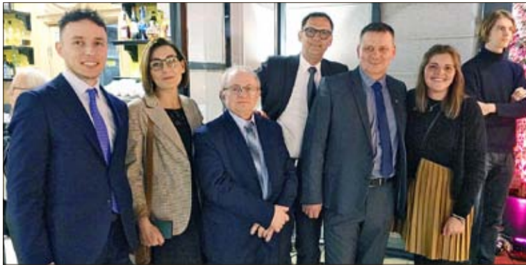
Die Gäste von der Allensteiner deutschen Minderheit beim Neujahrsempfang in Zoppot

Für 2024 gibt es einige thematische Schwerpunkte: 300 Jahre Immanuel