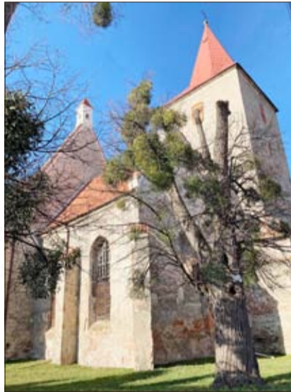
Die Kirche ist momentan für Besucher geschlossen. Die Restaurierungsarbeiten sind in vollem Gange.