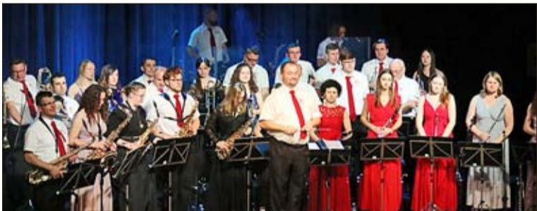
Die Orchestermitglieder blicken gespannt und voller Energie in die Zukunft.