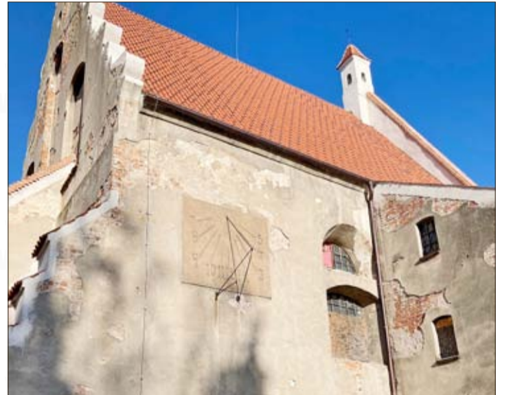
An der Fassade ist eine beeindruckende Sonnenuhr erhalten geblieben.

stellt die Kreuzigung Christi dar. In der Kirche befindet sich auch die Krypta der Familie von Beess mit Grabtafeln der Frauen dieser Familie.