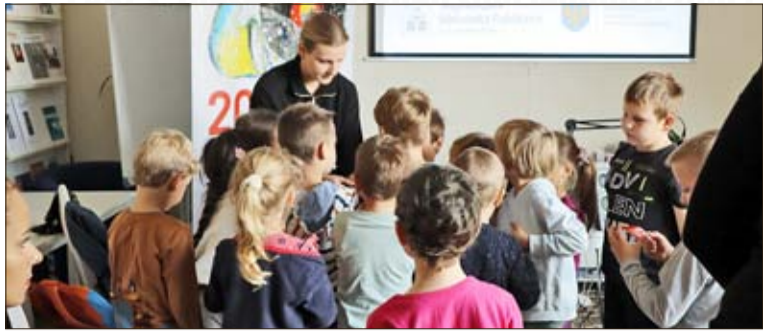
Die Österreich Bibliothek in Oppeln hat ein breites Spektrum an Angeboten für Schüler.

Auch im Februar hält die Österreich-Bibliothek ein reichhaltiges Programm für Kulturliebhaber bereit. Ein Resümee über ein Stück Österreich, mitten in Oppeln.