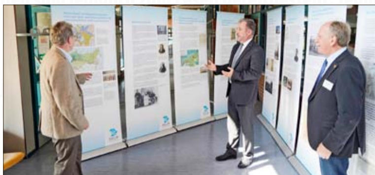
Mobile Ausstellungen sind eines der Tätigkeitsfelder des Kulturzentrums.