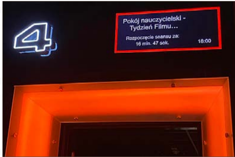
Eine der präsentierten Produktionen war der Oscar-nominierte Film „Das Lehrerzimmer“.