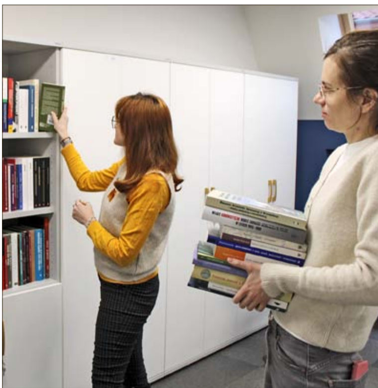
Die Mitarbeiter des Zentrums bereiten eine Handbibliothek für die Besucher vor.

„Wir hoffen also, dass unser Zentrum auch in diesem Jahr mit Leben pulsieren wird. Wir versuchen, Mittel für weitere Aktivitäten zu beschaffen – dazu haben wir eine Reihe von Projektanträgen ein-