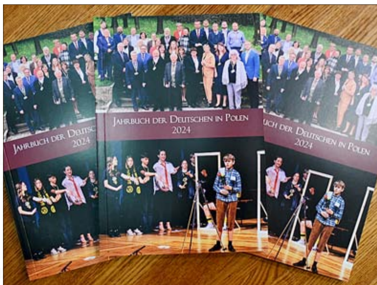
Seit 13 Jahren wird das Jahrbuch des VdG herausgegeben.

Interessierte Leser können sich beim VdG (tel. 77 454 78 78) melden und das Jahrbuch direkt beim Herausgeber erhalten.