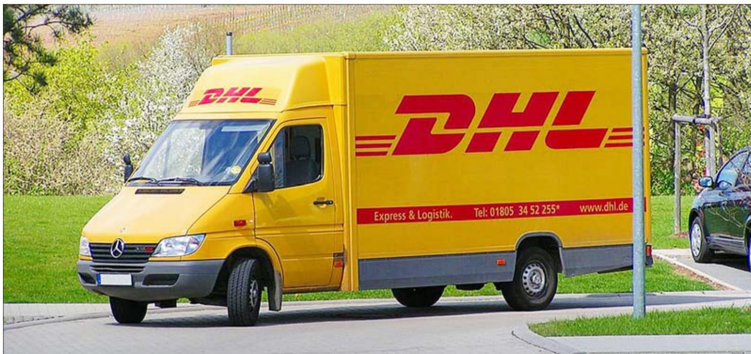
Das deutsche Kurierunternehmen DHL-Express entwickelt derzeit eigene Mehrwegverpackungslösungen für den Online-Handel.

Bestellen, auspacken, Kartons wegwerfen – so handeln Online-Shopper in