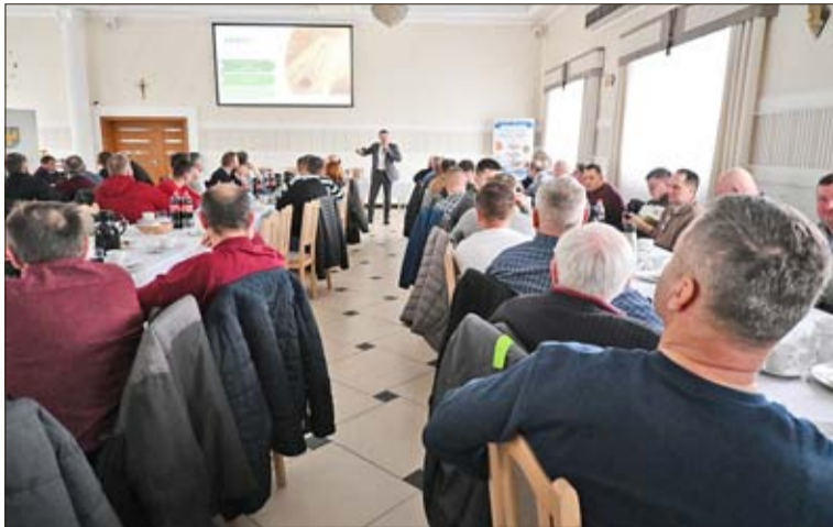
Die Kreissitzungen des Verbandes Schlesischer Bauern haben auch einen Schulungsaspekt.

Die immer schwierigere Lage der Landwirte ist auch ein wichtiges Thema bei den Kreissitzungen, zumal am 24. Januar Bauern in ganz Europa gegen die gemeinsame Agrarpolitik der Europäischen Union und die zollfreie und unbegrenzte Einfuhr von Agrarerzeugnissen aus der Ukraine protestierten. Auch in