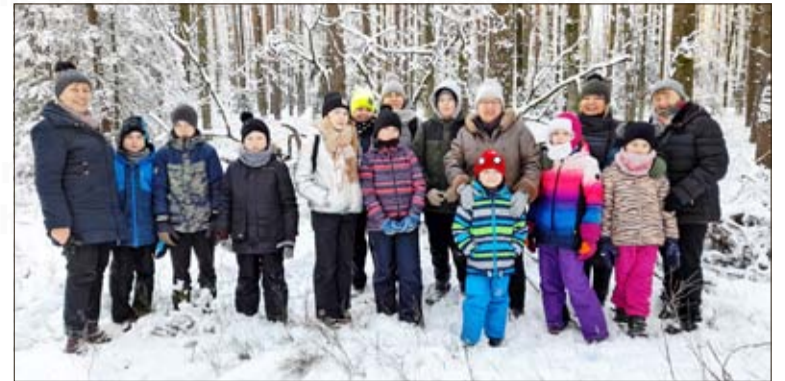
Der DFK Zelasno nahm die Kinder mit auf Erkundungstour in den Wald.

Das dritte Winterferienangebot war eine Fahrt nach Oberglogau, wo