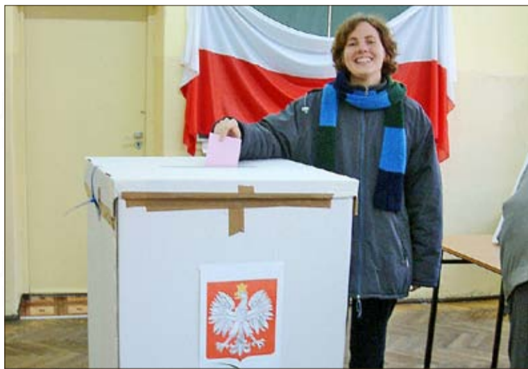
Am 7. April wird über die Selbstverwaltungen entschieden.

Da wundert es nicht, wenn man sich jetzt, so lange es geht, Ruhe gönnt. Doch auch diese Zeit der Ruhe wird in weni-