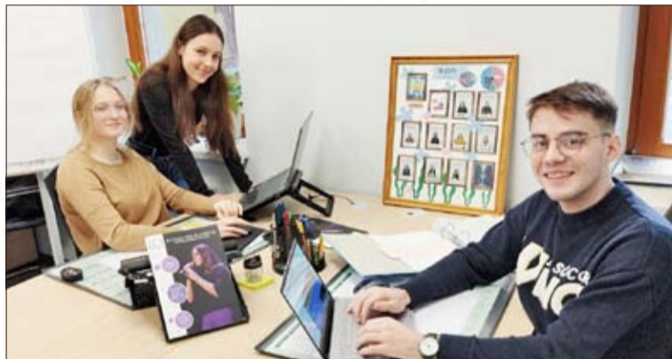
Der BJDm hat seit kurzem einen neuen Sitz.

Es gab einige Projekte, die nicht so reibungslos verlaufen sind, obwohl sie problemlos hätten verlaufen sollen. Dabei will ich aber keine konkreten Titel und Organisationen nennen, denn wir wollen unsere Mitglieder und die dort Beschäftigten und vor allem Ehrenamtlichen nicht kritisieren. In inter-