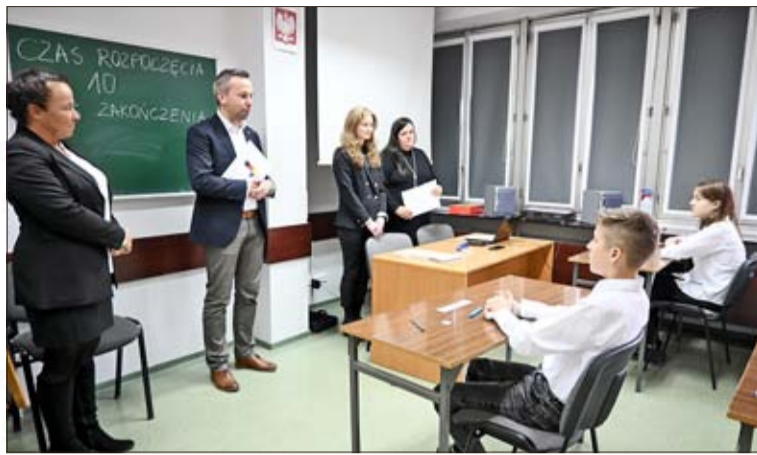
Wer 90% oder mehr der vergebenen Punkte erreicht, hat die Abschlussprüfung der 8. Klasse automatisch mit Bestnote bestanden.

Die Lehrer betonen dabei deutlich, dass der Stellenwert der deutschen Sprache für die berufliche Zukunft der Kinder kaum überschätzt werden kann. „Gerade in unserer Region ist Deutsch ziemlich wichtig, da wir hier nicht nur