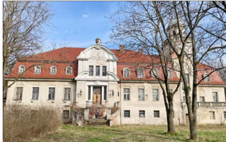
Über die Entstehungsgeschichte des Schlosses Frohnau ist wenig bekannt. Der Ort selbst wurde 1374 als ein Dorf namens Wrona erwähnt.

Frohnau. Nach dem Zweiten Weltkrieg war Schloss Frohnau lange Zeit staatlicher Besitz. Es beherbergte verschiedene landwirtschaftliche Institutionen. Das Schloss steht seit 1981 unter Denkmalschutz. Seit einiger Zeit wird es von ei-