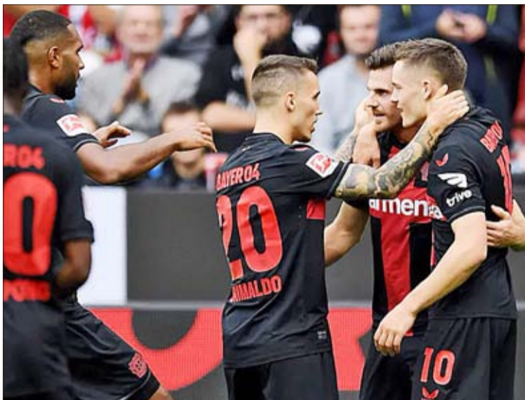
Radość w obozie Bayeru 04 Leverkusen jest zrozumiała. Po wygraniu derbów Renu z 1. FC Köln „Aptekarze” są bliscy zdobycia pierwszego w swojej historii tytułu mistrza Niemiec.

Atut własnego boiska wykorzystał TSG 1899 Hoffenheim, który w Sinheim pokonał Werder Bremen 2-1. Gospodarze od pierwszych minut pojedynku przewyższali gości kulturą gry i realizacją założeń taktycznych. Do tego znakomicie prezentował się 21-letni Beier, wschodząca gwiazda niemieckiego futbolu, który już w 8. min (asysta Stacha) wysunął „Hoffe” na prowadzenie. Werder dopiero po pół-