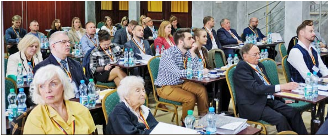
Verbandsratssitzung des VdG auf dem St. Annaberg

Deshalb müssen wir nach anderen Geldquellen suchen. Wir motivieren unsere Mitgliedsorganisationen immer, nach Drittmitteln in anderen Organisationen, bei Selbstverwaltungen oder privaten Sponsoren zu suchen, weil das auch ggf. erlaubt Initiativen zu starten, die so von der deutschen oder polni-