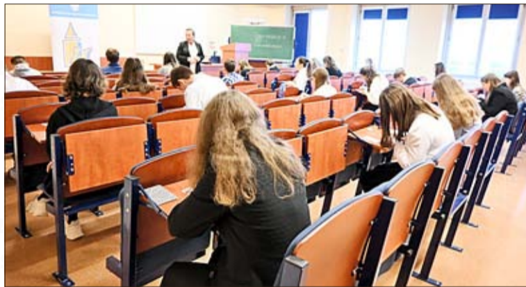
Insgesamt 34 Finalisten aus der gesamten Woiwodschaft Oppeln hatten sich auf Schul- und dann auf Gemeindeebene gegen ihre Mitbewerber durchgesetzt.