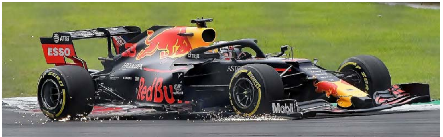
Max Verstappen und das Red Bull-Team starten hervorragend in die F1-Saison