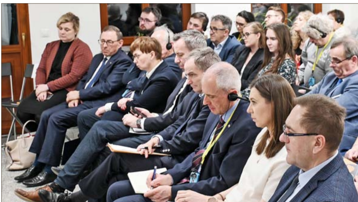
Bei der ersten Podiumsdiskussion nach dem Regierungswechsel blieb kein Stuhl leer.