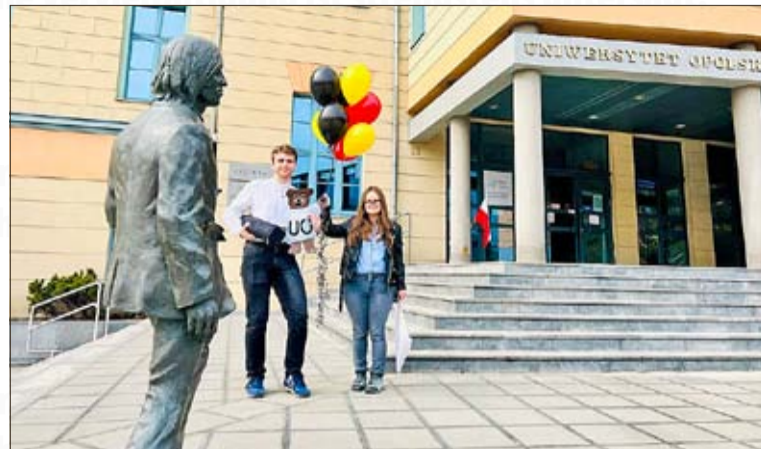
Do udziału w wydarzeniach Tygodnia Germanistyki Opolskiej zachęcają też studenci.