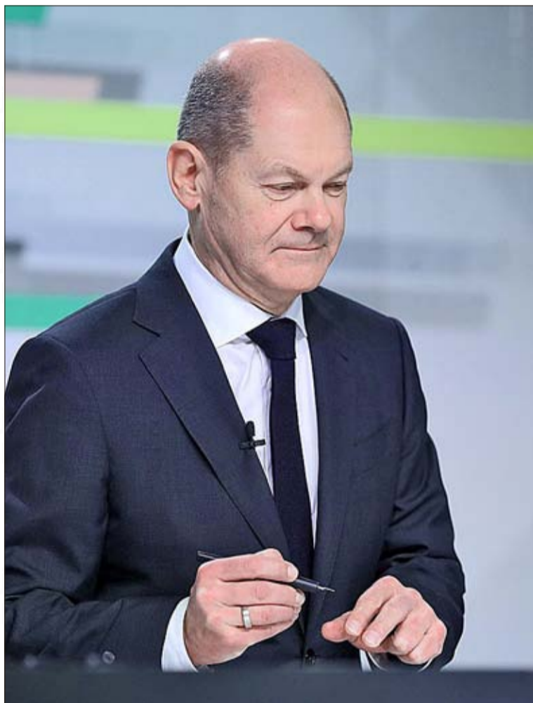
Der deutsche Bundeskanzler Olaf Scholz

„Wenn immer wieder von Bürokratieabbau die Rede ist, darf das nicht nur bedeuten, dass es viel weniger Regulierung geben wird. Die Zahl der Beamten muss spürbar sinken, zum Beispiel durch Nichtbesetzung freier Stellen im öffentlichen Dienst. Das würde auch dafür sorgen, dass die notwendigen Mittel für staatliche Investitionen frei werden: in Straßen, Brücken oder die Digitalisierung“, schreibt der „Reutlinger General-Anzeiger“ aus Baden-Württemberg. Die „Mitteldeutsche Zeitung“ verweist dagegen auf die Differenzen zwischen den Koalitionsparteien bei Haushaltsprioritäten und Haushaltsdisziplin. „Wer Robert Habeck kennt, weiß, wie sehr ihn das schmerzt. Das Problem könnte Finanzminister Christian Lindner (FDP) lösen, doch der hält trotz der Krise konsequent an einer Politik der Haushaltskonsolidierung fest.“ Nun, bis Christian Lindner den richtigen Schritt macht, sind Robert Habeck die Hände