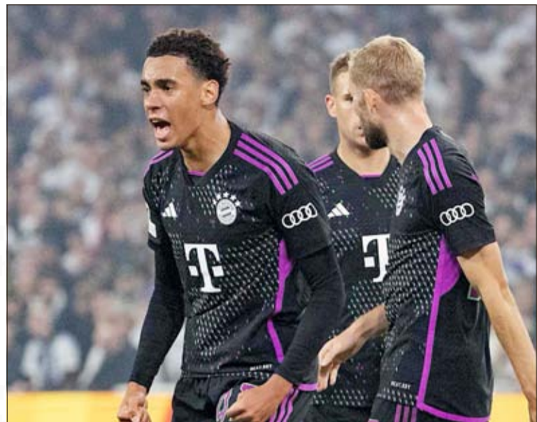
Po remisie 2-2 we Freiburgu szansa Bayernu München na obronę tytułu bardzo poważnie stopniała.