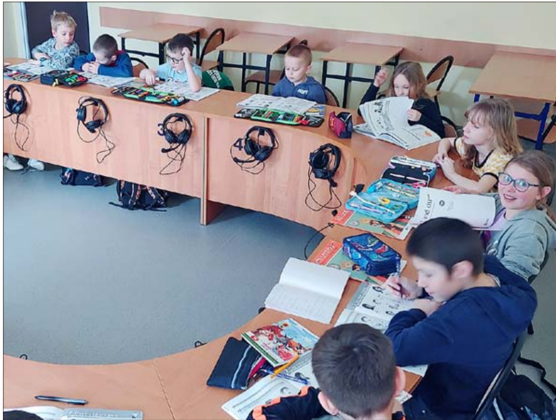
Unterricht in der Schule in Sonntag (Zyndaki)

Weiterhin befindet sich die große Mehrheit der Schulen in kleinen Dörfern. Allerdings: Dort, wo es die meisten Angehörigen der deutschen Minder-