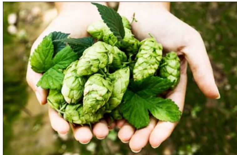
Chmiel wspaniale uspokaja, wycisza i koi skołataną nerwy.

To małe, niepozorne ziółko, dla wielu z nas zwykły chwast, jest bardzo prozdrowotne. Przeciwdziała infekcjom