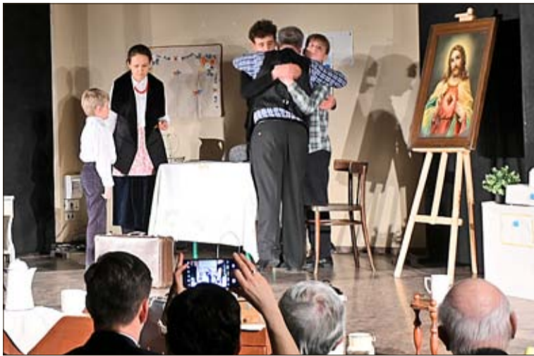
Auf der Bühne: Schüler und Mitarbeiter des Schul- und Kindergartenkomplexes Nr. 13 in Gleiwitz, aber auch mit dem tragischem Teil der Geschichte Schlesiens verbundene Menschen.