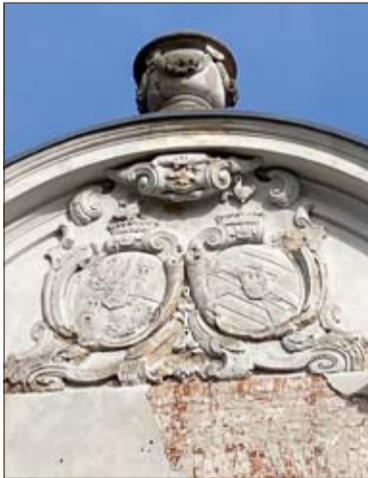
Über dem Eingang befinden sich die Wappen der zwei Familien, die im Schloss lebten: von Ballestrem (links) und von Schalscha.