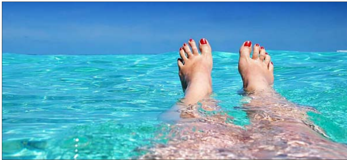
Urlopuj mądrze i świadomie.

Pracownik zatrudniony w niepełnym wymiarze godzin pracuje 4 godziny dziennie przez 5 dni w tygodniu. Może on się również ubiegać o ustawowe minimalne prawo do urlopu w wymiarze 20 dni. Za każdy dzień urlopu wypłacone są jednak tylko 4 godziny. Jeśli zatrudnienie jest nieregularne i nie ma powtarzającego się schematu pracy, obliczenia muszą się opierać na zobowiązaniu do pracy w danym roku kalendarzowym. Podstawą do tego jest obowiązek pracy wynoszący 260 dni w pięciodniowym tygodniu pracy (52 tygodnie w roku \times 5 dni w tygodniu) i 312 dni roboczych w sześciodniowym tygodniu pracy. Przykładowo: Pełnoetatowi pracownicy danej firmy otrzymują 30 dni urlopu przy pięciodniowym tygodniu pracy. Pracownik zatrudniony