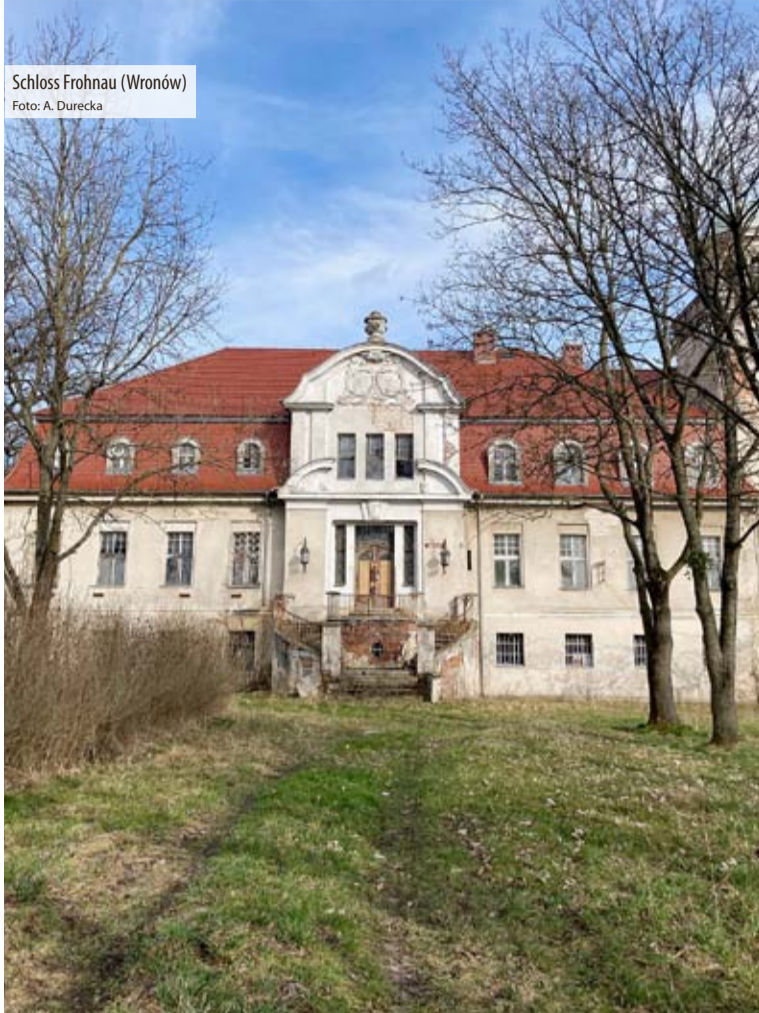
Schloss Frohnau (Wronów)