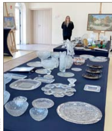
In einem der errichteten Pavillons kann man derzeit die Ausstellung der Arbeiten des Ehepaars Drost bewundern.