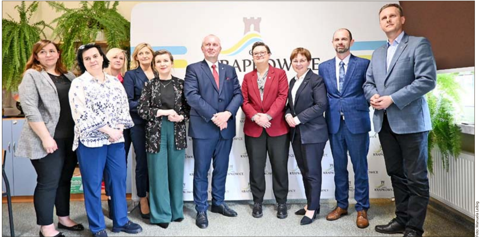
Bei einem Pressebriefing mit Vertretern der Sozial-Kulturellen Gesellschaft der Deutschen im Oppelner Schlesien bestätigte Ministerin Lubnauer die Rückkehr von drei Stunden Deutsch als Minderheitensprache ab dem 1. September 2024.

„Es ist klar, dass das, was jetzt die Politik des Ministeriums begleiten sollte, das Wohl der Kinder ist. Und zum Wohl der Kinder gehört sowohl die Möglichkeit, die Sprache ihrer Vorfahren zu lernen, als auch, dass sie sich durch das Erlernen einer zweiten Sprache weiterentwickeln, dass sie die Chance haben, Wissen zu erwerben. Deshalb wurde bereits im Februar eine Verordnung ausgearbeitet und ins Gesetzbuch aufgenommen“, berichtete Ministerin Lubnauer und fügte