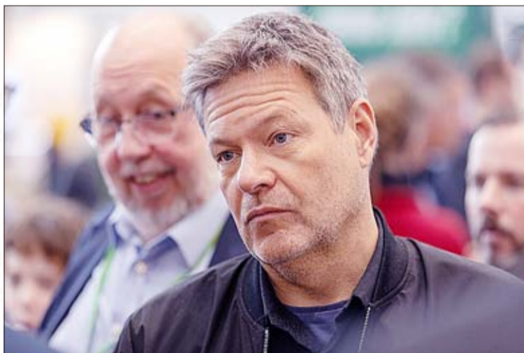
Wirtschaftsminister Robert Habeck

„Nicht alle Ursachen dieses Mangels sind nationalen Ursprungs. Aber einige schon“, schreibt die „Die Glocke“ aus dem nordrhein-westfälischen Oelde und erinnert an die Auseinandersetzungen in der Koalition, vor allem zwischen den Chefs der Wirtschaftsressorts, Finanzminister Christian Lindner von der FDP und Wirtschaftsminister Robert Habeck von den Grünen: „Die einen schließen Fabriken wegen der horren-