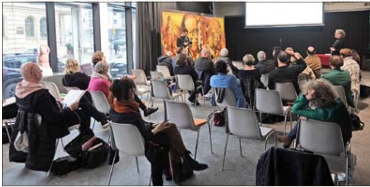
Konferenz zu Erich Mendelsohn im Mendelsohn-Lyzeum unter den Augen von Mendelsohn

Zum 21. März, dem Geburtstag des weltbekannten, in Allenstein geborenen Architekten Erich Mendelsohn (1887-1953), versammelten sich in Allenstein Experten verschiedener Fachgebiete für zwei Tage im Erich-Mendelsohn-Lyzeum der bildenden Künste, um – unter den Augen von Mendelsohn – über „Erich Mendelsohns architektonisches Erbe auf seinem Weg auf die Liste des Weltkulturerbes der UNESCO“, so der Titel der Konferenz, zu diskutieren.