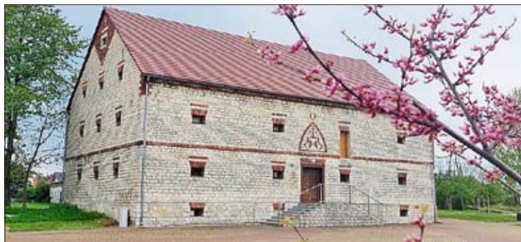
Die Einwohner sind stolz auf ihren schön renovierten Speicher.

Die Einwohner von Broschütz haben beschlossen, diese Auszeichnung zu nutzen und ein Werbevideo zu drehen, in dem sie die Geschichte des Kornspeichers und des Gutes darstellen. Sie selbst spielen darin mit. Das Video ist auf dem Facebook-Profil der Gemeinde