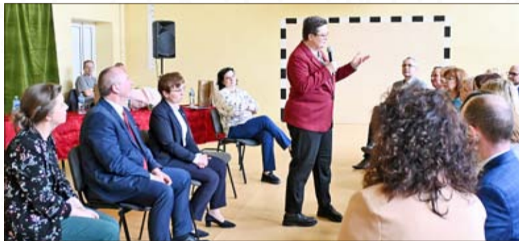
Die Bildungsministerin Katarzyna Lubnauer traf sich mit Lehrern und Schulleitern der Gemeinde Krappitz.

Noch ungelöst ist allerdings die Frage des Unterrichts von Deutsch als Minderheitensprache in den Klassen 7 und 8. Die derzeitige Situation sieht so aus, dass die Schule laut Verordnung entweder entscheiden muss, dass das Kind noch eine Sprache als zweite Sprache lernt, oder dass Deutsch die zweite Sprache sein wird, und dann wird Deutsch als Minderheitensprache nicht mehr unterrichtet. „Dieser Ansatz ist natürlich zum Nachteil der Kinder. Wir arbeiten derzeit an einer Lösung, die wieder auf dem Prinzip der Chancengleichheit für alle beruht und in allen Schulen umgesetzt wird. Es gibt noch ein weiteres Problem. In Schulen in größeren Städten, wie hier in Krappitz, war es möglich, einen Lehrer für Italienisch zu finden.