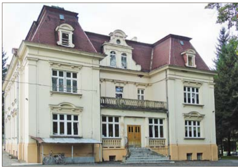
In diesem Schloss befindet sich heute eine Erziehungsanstalt für jugendliche Straftäter.