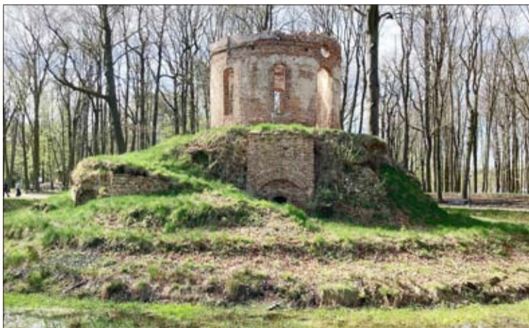
Die Ruine des Wasserpavillons ist umringt von einer Wassergrube.

Auch die Fülle der Flora im Carlsruher Park kann nicht hoch genug geschätzt werden. Hinter dem „Schlafenden Löwen“ sind eine Buche, eine Linde und eine Hainbuche miteinander verwachsen. Bald wird man die blühenden Rhododendren bewundern können. Es gibt eine alte Hainbuchenallee und viele uralte Bäume wie eine Rotbuche mit einem Umfang von 340 Zentimetern und eine Sumpfeiche mit einem Umfang von 190 Zentime-