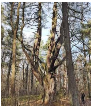
Die Polens älteste und größte Strobe, auch Weymouth-Kiefer genannt, wächst im englischen Teil des Parks in Carlsruhe.