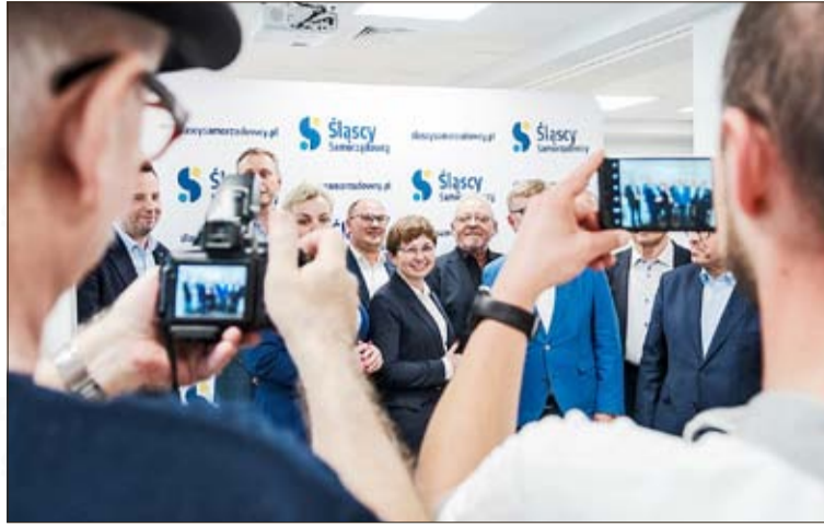
Vertreter der Schlesischen Regionalpolitiker am Tag nach der Wahl