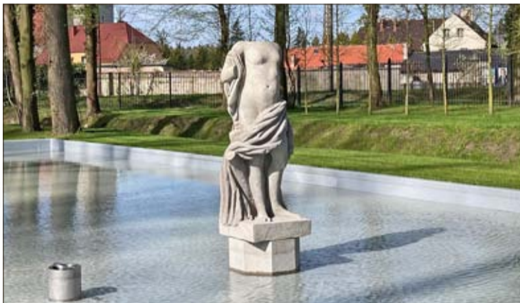
Insgesamt drei Springbrunnen wurden im Park errichtet.