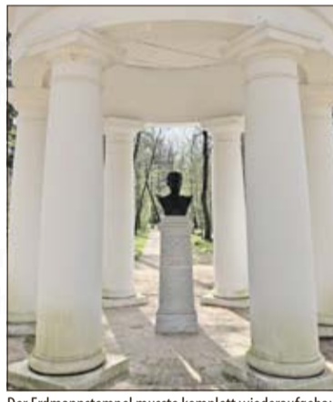
Der Erdmannstempel musste komplett wiederaufgebaut werden.