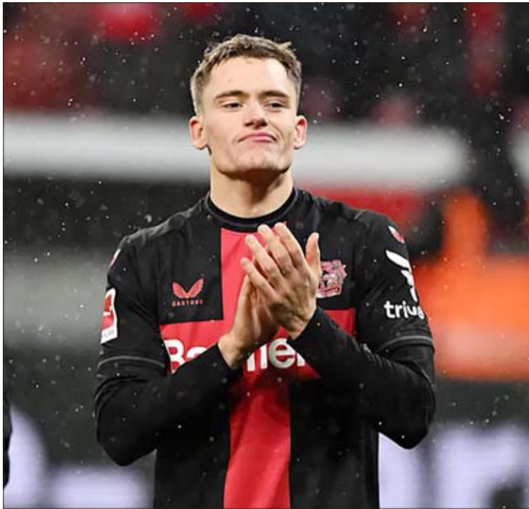
Florian Wirtz zdecydował o wygranej Bayeru 04 Leverkusen w Berlinie z 1. FC Union.

Porażkę wicelidera – Bayernu – wykorzystał trzeci w tabeli VfB Stuttgart, który w szlagierze kolejki 1-0 wygrał w Dortmundzie z tamtejszą Borussią, która rundę wcześniej pokonała w München Bayern 2-0. Pierwszą część spotkania oba zespoły poświęciły na badanie swoich możliwości, stąd w tej części gry nie było zbyt wielu interesujących momentów. Po przerwie zarówno gospodarze, jak i goście zaczęli konkretniej atakować, ale Borussia częściej strzelała na bramkę, co było efektem „gonienia wyniku”. Goście bowiem od 64. min wygrywali 1-0, kiedy to podanie Lewelinga na bramkę