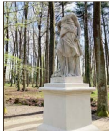
Die Skulptur der Göttin Diana aus dem Jahr 1790