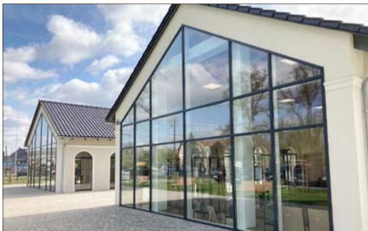
In diesen Pavillons werden künftig Workshops für Schüler zum Thema Ökologie und Natur angeboten.