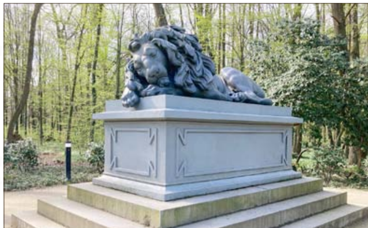
Die berühmteste Sehenswürdigkeit im Carlsruher Park: der „Schlafende Löwe“ von Theodor Kalide

Park w Pokoju został założony w drugiej połowie XVIII w. Składa się z trzech części: parku francuskiego, parku krajo-