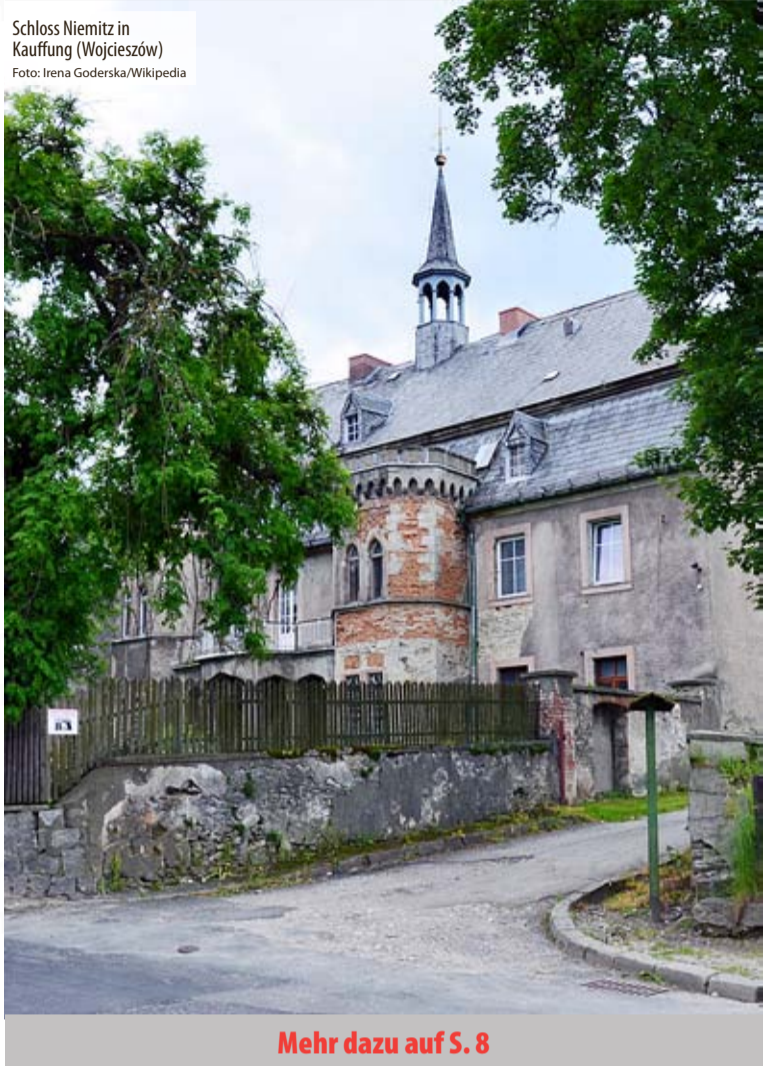
Schloss Niemitz in Kauffung (Wojcieszów)