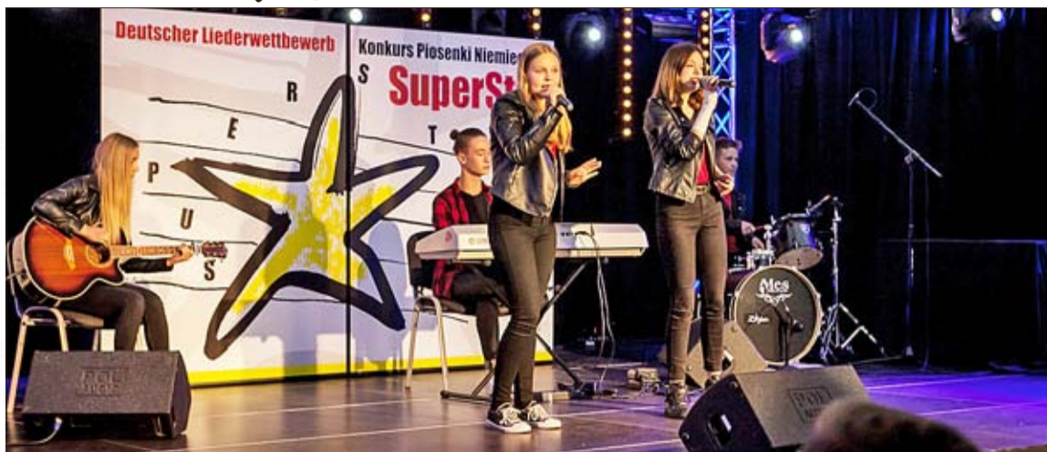
Nagranie z własnym występem należy przesłać do 2 czerwca.