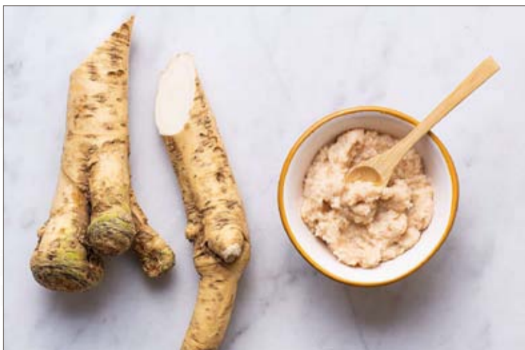
Z chrzanu można przygotować naturalny syrop lub leczniczą nalewkę.

Ma właściwości przeciwbakteryjne i grzybobójcze. Działa przeciwnowotworowo, antyseptycznie, a w postaci syropu – wykrztuśnie. Przyspiesza przemianę materii, pobudza wydzielanie soków trawiennych i wspiera działanie układu pokarmowego. Roślina ma także niewielkie