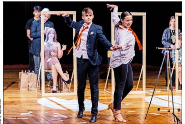
Aufführung aus dem letzten Jahr

Ponadto scenografia, inscenizacja i wreszcie reklama spektaklu są pro-