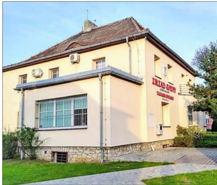
Das Gemeindeamt von Tarnau

Wybory samorządowe dobiegły końca, a to oznacza dla mnie nowy początek. Ubiegałem się o urząd wójta gminy