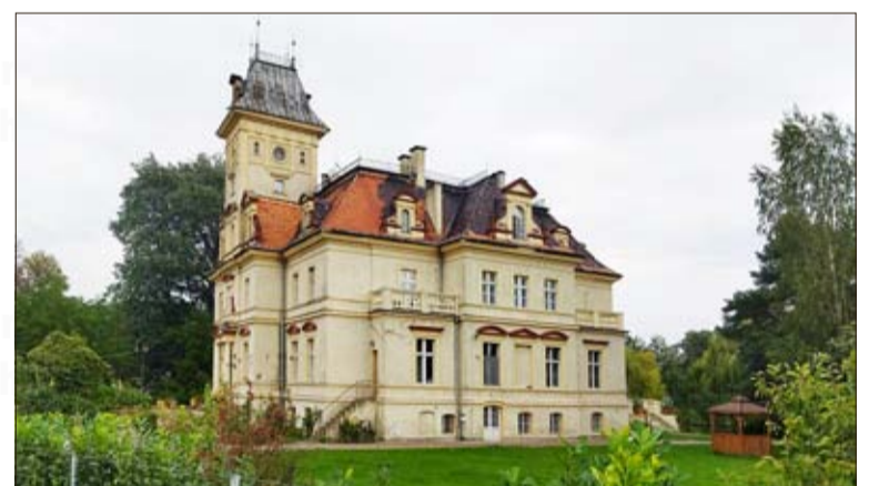
Das Schloss in Schwengfeld erinnert heute an die Familie Websky aus Nieder Wüstegiersdorf.

Auf diese Weise kommen wir auf dem Gipfel des Poppelberges an. Dieser Hügel zählt 285 Meter und ist mit einem Wald bewachsen. Die Spitze selbst bietet deshalb keine direkten Ausblicke. Unsere Augen können wir aber, kurz bevor wir das Wäldchen betreten, an Panoramen erfreuen. Der sanfte Nordhang