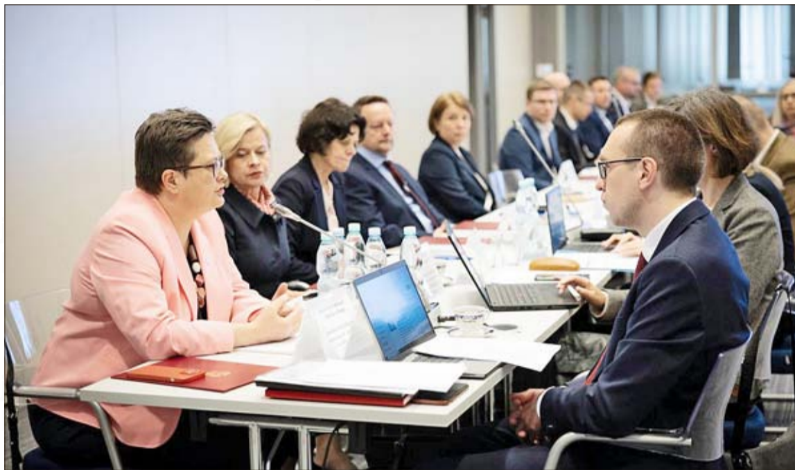
Auf der Sitzung wurde den Bildungsfragen viel Raum gewidmet. Im Bild links die stellvertretende Bildungsministerin Katarzyna Lubnauer.

Die erste Sitzung der Gemeinsamen Kommission von Regierung und Minderheiten seit neun Monaten war jedoch nicht nur allgemeinen Fragen gewidmet. Die Minderheitenvertreter wiesen auch auf aktuelle Probleme hin, die in den letzten Jahren von der Regierungsseite offenbar vernachlässigt worden waren. „Ich habe zum Beispiel auf die Frage der zweisprachigen Beschilderung in vier Gemeinden hingewiesen, in denen das Verfahren längst abgeschlossen ist, die Aufstellung der Schilder aber aus politischen Gründen blockiert wurde. Dabei handelt es sich um zwei Gemeinden in der Woiwodschaft Schlesien und um ausgewählte Orte in den Gemeinden Groß Strehlitz und Zawadzki, je nach dem Ergebnis der öffentlichen Konsultationen. Ich habe gefordert, dass die zweisprachigen Schilder dort so schnell wie