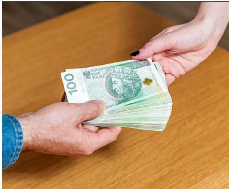
Warto się zapoznać z umowami najmu i pożyczkami między członkami rodziny.