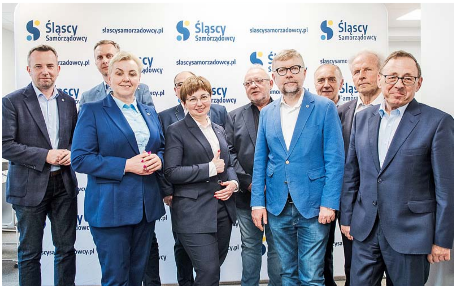
Die Schlesischen Regionalpolitiker haben allen Grund zur Freude und Genugtuung.

Nun, für ein politisches Projekt mit einer Geschichte von nur vier Monaten kann man nicht von einem großen, sondern von einem sehr großen Wahlerfolg sprechen. Falls jemand daran zweifelt, sollte er sich die Zahl der Kommunalbeamten des Wahlkomitees Schlesische Regionalpolitiker auf der Ebene der Gemeindevorsteher und Bürgermeister in der Woiwodschaft Oppeln und der fünf Sejmik-Mitglieder ansehen. Es sei auch darauf hingewiesen, dass der Hauptgedanke bei der Gründung des Wahlkomitees Schlesische Regionalpolitiker als Wahlkomitee des Schlesischen Selbstverwaltungsvereins – einer Organisation, die auf eine etwa 30-jährige Tradition zurückblicken kann – darin besteht, ein langfristiges Projekt zu schaffen. Ein Projekt, das das Geschehen in den Gemeinden und Kreisen der Region Oppeln in Zukunft wirklich und