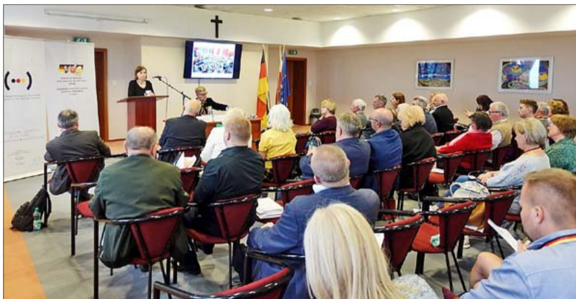
Die Konferenz findet traditionell auf dem Sankt Annaberg statt.