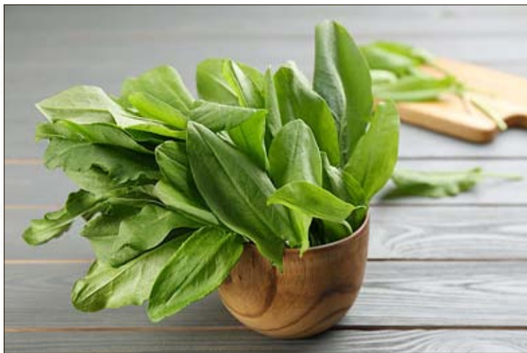
Pasteryzowany szczaw należy przechowywać w chłodnym miejscu. Innym sposobem przedłużenia trwałości rośliny jest jej zamrożenie.

pomaga przy obrzękach, spowalnia procesy starzenia organizmu oraz działa przeciwbólowo. Kwas askorbinowy zawarty w szczawiu chroni też przed patogenami wywołującymi choroby. Na uwagę zasługuje fakt, że zarówno witamina C, jak i witamina A pomagają w leczeniu chorób skóry, a suszony szczaw sprawdza się jako zdrowotny napój, skuteczny w walce z suchością naskórka i grzybicą skóry. Leczy się nim również wysypkę, obrzęki oraz stłuszczenia ciała. Natomiast beta-karoten i sama witamina A zawarte w roślinie wpływają