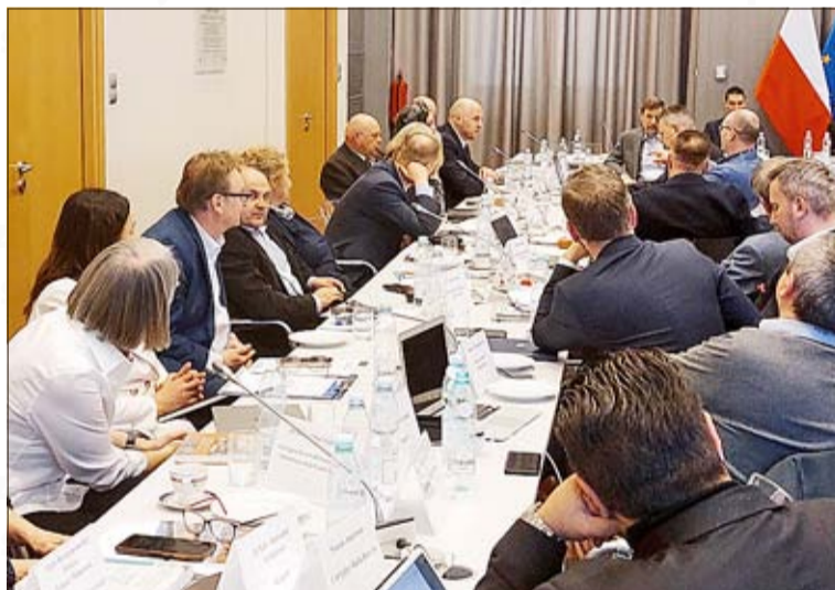
Nach neun Monaten kamen die Vertreter der Minderheiten und der Regierung zu ihrer ersten Sitzung zusammen.

mit Minderheiten gewöhnt hat, diese angekündigte Politik des guten Willens und der Aktivität auch umsetzen kann.“