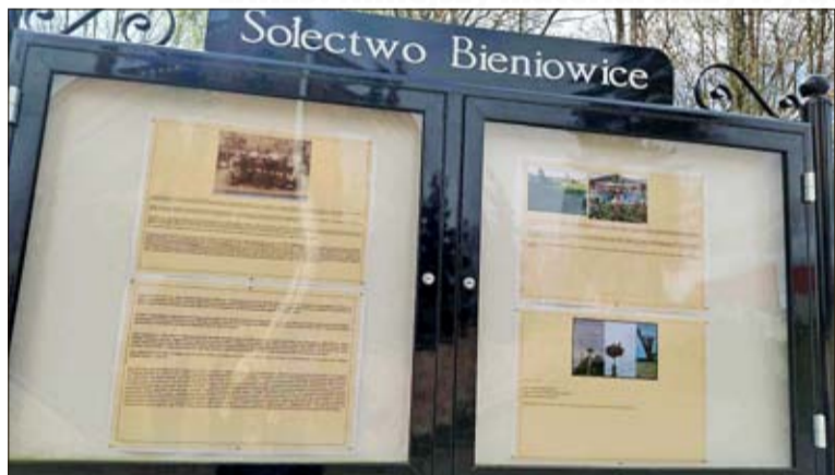
Die Geschichte von Bienowitz wurde auf Schautafeln gedruckt und an zentralen Orten aufgestellt.

Ein Beispiel für das Besinnen auf die gemeinsame deutsch-polnische Geschichte findet sich seit Neuestem in Bienowitz. Dort wurden nämlich die lange Geschichte des Ortes – von den Anfängen bis heute, einschließlich der 700 Jahre deutscher Geschichte – und die historische Bedeutung, die die Umgebung alleine durch vier berühmte Katzbach-Schlachten erhält, auf Schautafeln gedruckt und an zentralen Orten aufgestellt.