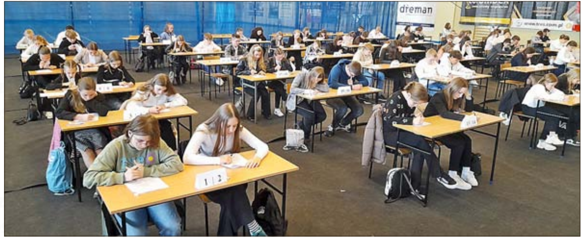
Mehr als 80 Kinder und Jugendliche nahmen am Finale des Wissenswettbewerbs teil.