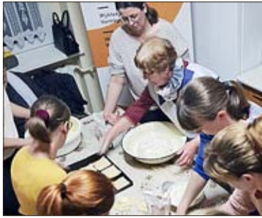
Workshop des vergangenen Jahres

Ein weiteres sehr besonderes Projekt ist das Archiv der erzählten Geschichte. Online wurden bereits über 600 Interviews veröffentlicht, in denen Zeitzeugen ihre Geschichte erzählen und so die Geschichte Ober- und Niederschlesiens, Pommern, Ermland und Masuren zum Leben erwecken. Aktuell werden noch