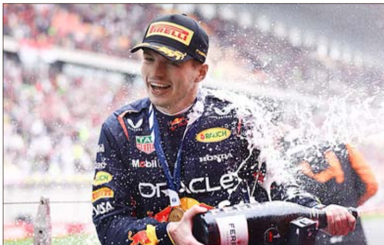
Max Verstappen ist nicht zu stoppen.

Ekipa Red Bulla stawia kolejne kamienie milowe swojej historii. Podczas weekendu w Szanghaju ekipa i jej lider zapisał nowe wpisy do swojego bogatego resume. Nie licząc