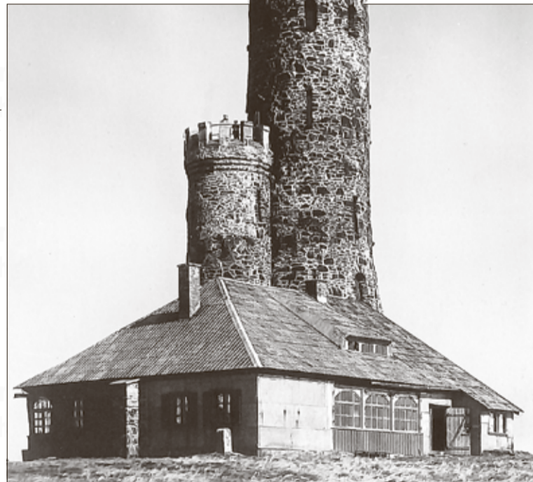
Der Turm wurde 1973 abgerissen.