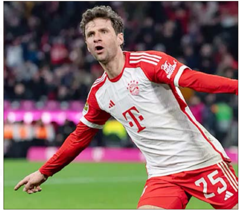
Pomimo 35 lat Thomas Müller wciąż jest w wysokiej formie. W minionej kolejce strzelił 2 gole z 5, jakie Bayern München zaaplikował w Berlinie ekipie 1. FC Union.

Z pościgu za Eintrachtem i zajęciem 6. lokaty na mecie rozgrywek nie rezygnuje TSG 1899 Hoffenheim. Team z Sinsheim w minionej serii po znakomitym spektaklu pokonał u siebie Borsussię Mönchengladbach 4-3. Miejscowi