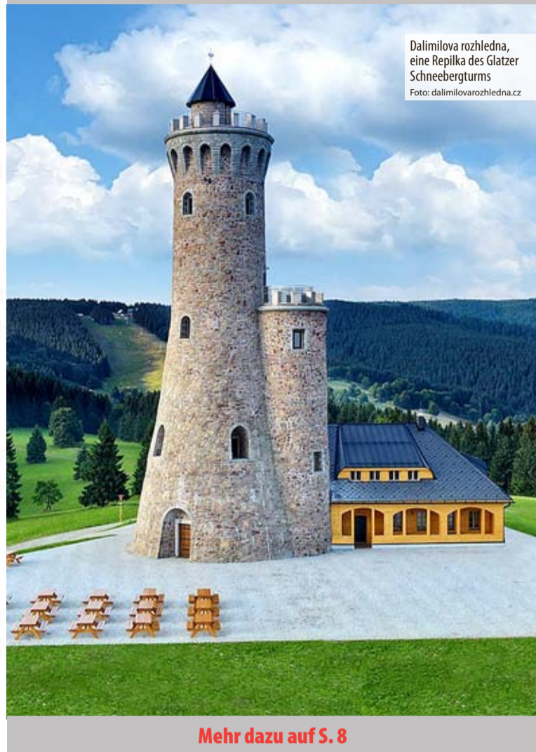
Dalimilova rozhledna, eine Replika des Glatzer Schneeburgturms